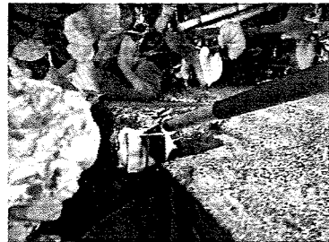
K1 金属標 (新設: 方向)