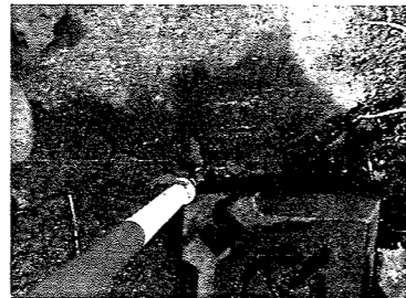
K2 ペンキ (計算点)